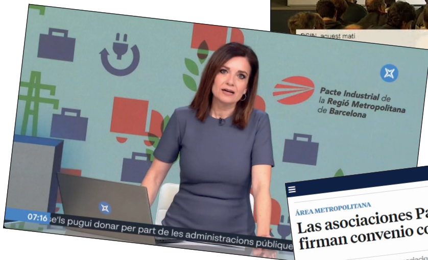
A l'esquerra: La Xarxa 23/11/2022