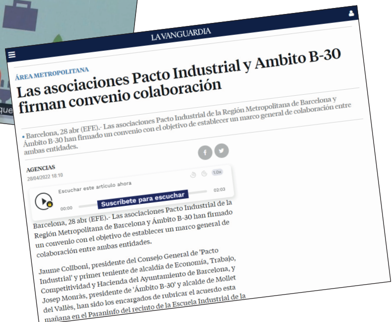
A la dreta: La Vanguardia (EFE) 28/04/2022