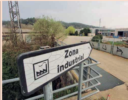
Els polígons han de cercar la cooperació amb l'emprenedoria local per millorar els serveis.

L'informe, elaborat per l'observatori econòmic Eivos, ha catalogat més de 150.000 actius comercials en més de mil polígons de tot Catalunya, posant de relleu aquest error estratègic que en molts casos