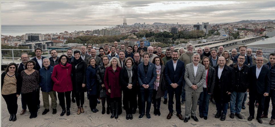
Foto de família dels assistents a la reunió.

El Pacte Industrial ha celebrat el seu XXVI Consell General i la 51a reunió del Comitè Executiu amb la participació dels representants dels ajuntaments i de les entitats que integren l'associació. Les reunions han tingut lloc el passat 22 de novembre al BCIN de Badalona. L'última vegada que la ciutat va acollir aquesta celebració va ser l'any 2008.