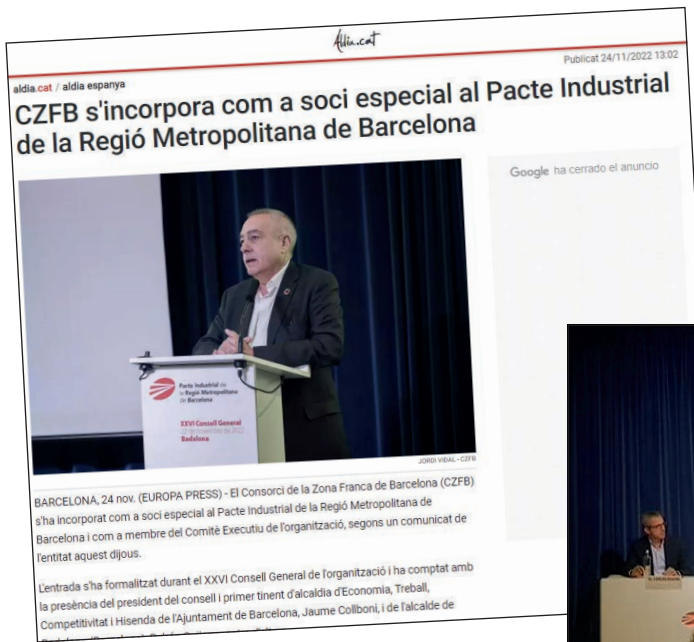
A l'esquerra: Europa Press 24/11/2022 A baix: Televisió de Badalona 22/11/2022