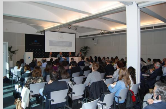
Un moment de la sessió presidida pel Pacte Industrial.