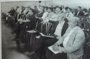
Un momento del Foro Empresarial de l'Horta Sud, ayer.

les- como en el desarrollo de infraestructuras y otros servicios que quedarán en manos de la citada asociación donde participarán los empresarios y creará la figura del Agente de Desarrollo Industrial. Elaboración de un censo Pendiente todavía de la elaboración de un censo de áreas básicas, consolidadas y avanzadas en la Comunitat Valenciana -que podría estar concluido en 2018- el director general de Industria y Energía también confía en la Generalitat destine recursos para la modernización de estos espacios durante los próximos tres años tras lograr 17,5 millones de euros en 2017. La nueva ley contempla la figura de Municipio Industrial Estratégico, tras cumplir algunos requisitos y que incluyen contar con una superficie superior a 1