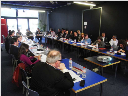
Un moment de la reunió número 41 del Comitè Executiu

El Pacte Industrial de la Regió Metropolitana de Barcelona ha celebrat el passat 8 d'abril la 41a Reunió del Comitè Executiu amb l'assistència dels representants dels ajuntaments i de les entitats que integren l'associació. La reunió, celebrada al Barcelona Advanced Industry Park (BAIP), ha finalitzat amb una visita guiada a les instal·lacions d'aquest nou equipament en què s'ha pogut visitar, entre altres espais, el taller mecànic per a la realització de prototips.