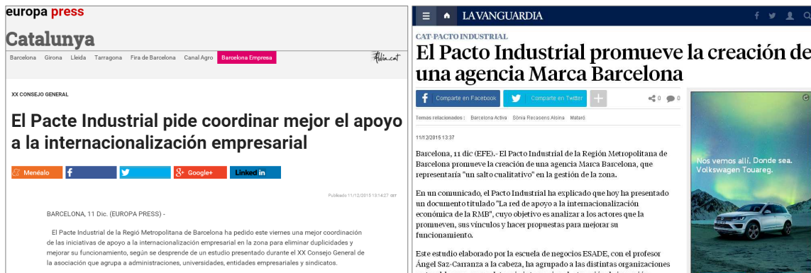
▲ Europa Press 11/12/15 ▼ Via Empresa 11/12/15 ▲ La Vanguardia (EFE) 11/12/15 ▼ m1tv 11/12/15

Notícies relatives a la presentació del Quadern 13 del Pacte Industrial, La xarxa de suport a la internacionalització econòmica de la RMB , i celebració del XX Consell General.